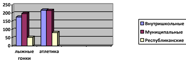
Диаграмма 2. Количество участников в 2022 году

Ежегодно обучающиеся МБОУ ДО «Питкярантская ДЮСШ» принимают участие в городских, республиканских, региональных спортивных мероприятиях. (Приложение к отчету)